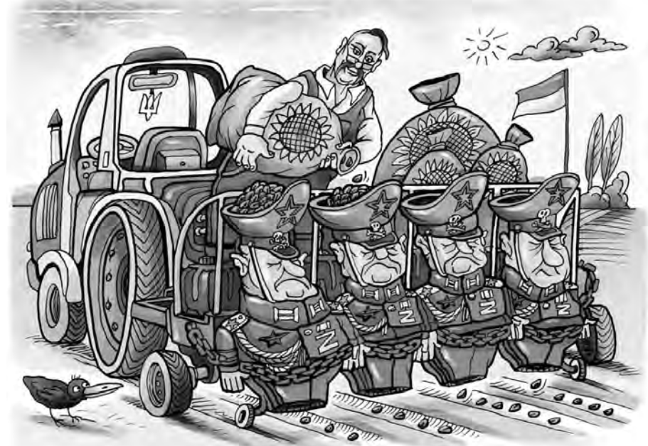
Гній у поле відвезеш — більше соняха збереш.